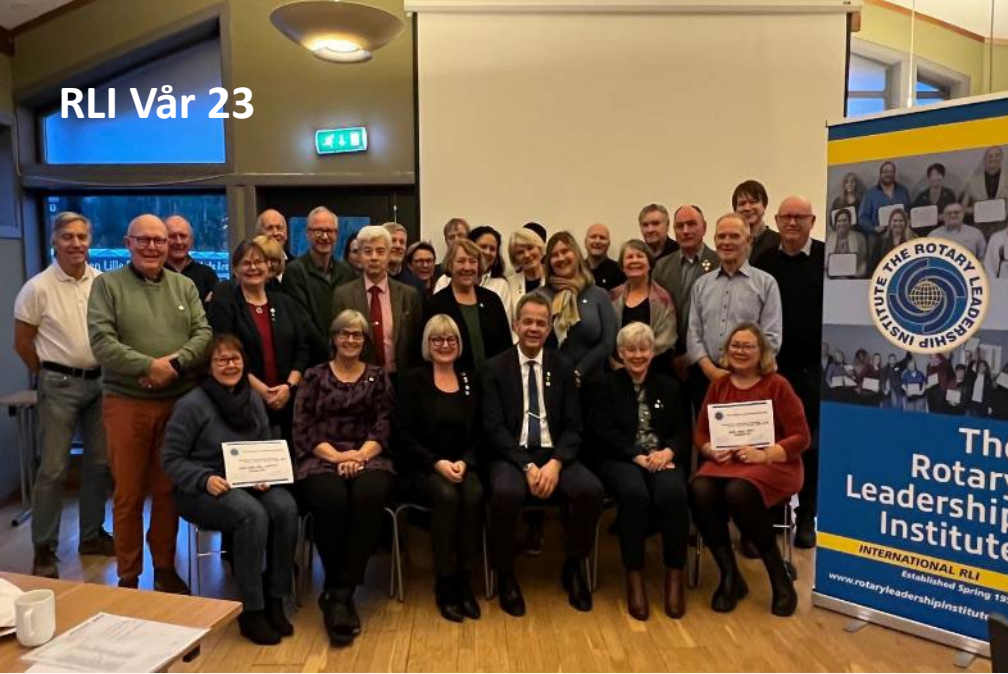
RLI Vår 23