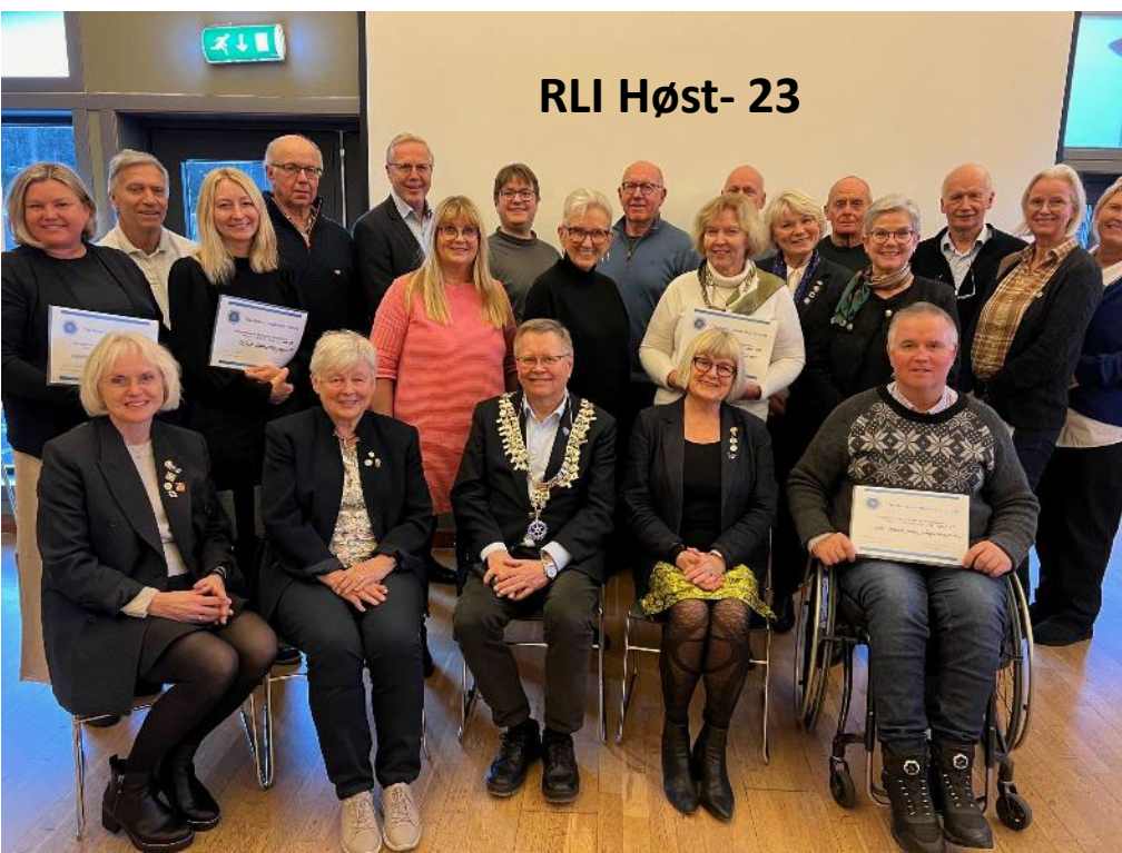
RLI Høst- 23