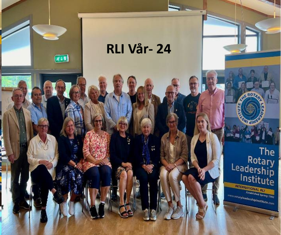
RLI Vår- 24