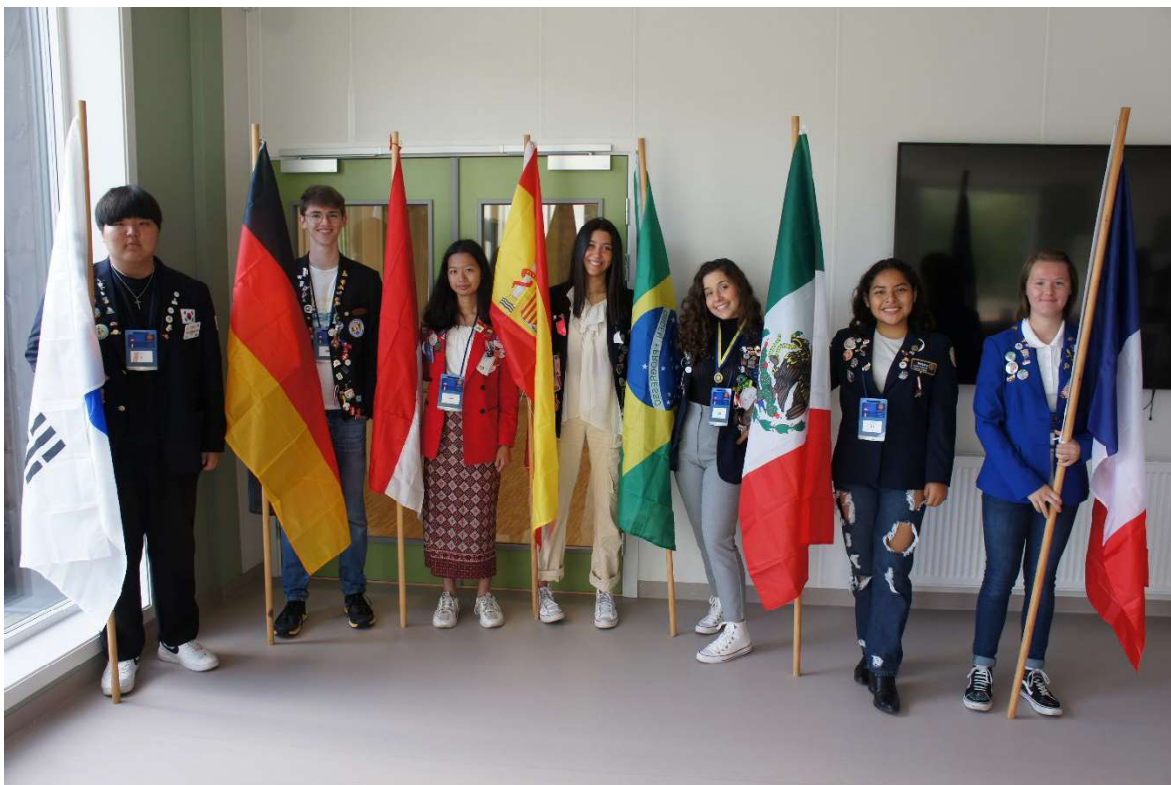
Dette er de utvekslingsstudentene vårt distrikt tok i mot dette rotaryåret.