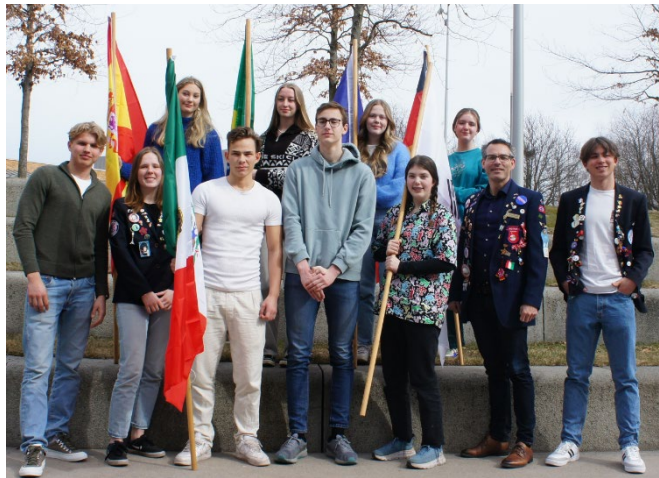
Bilde: Outbounds 2022-23 og rebounds på ambassadørkurset 3. apr. 2022

Ambassadørkurset for våre utreisende utvekslingsstudenter ble avholdt på Bakkenteigen søndag 3 april, 2022.