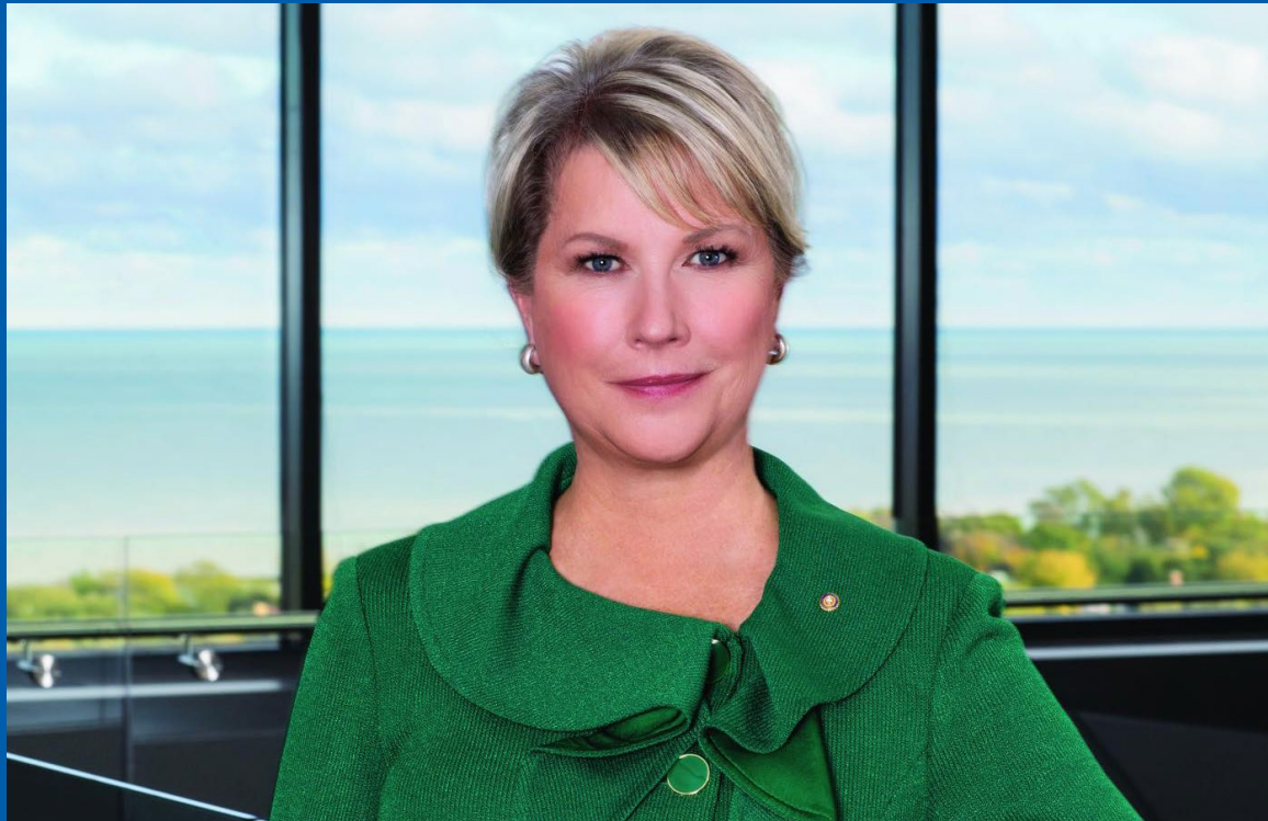
Første kvinnelige RI president i Rotary Rotary Club of Windsor-Roseland, Ontario, Canada