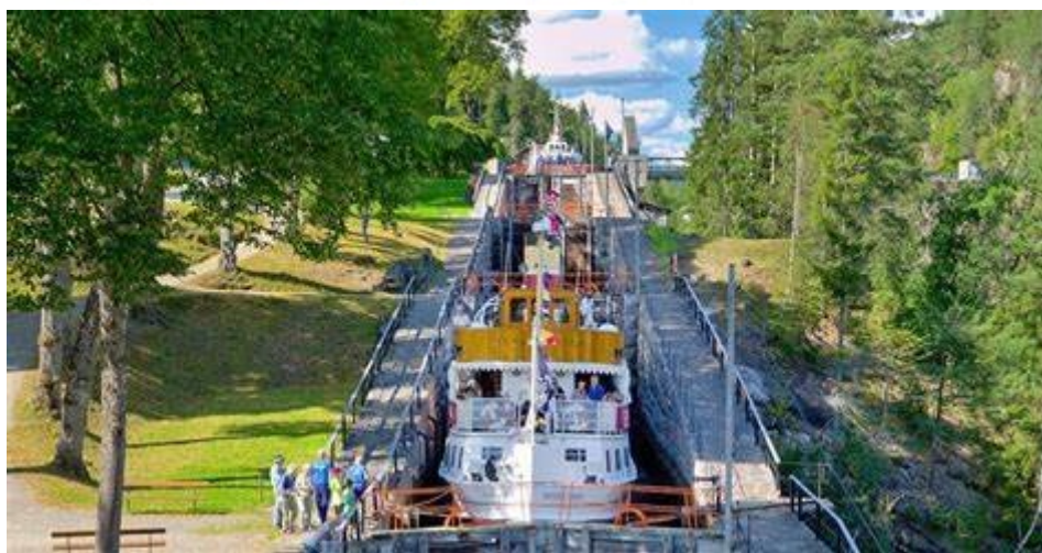
Telemarkskanalen og slusene – Må oppleves

Med god oversikt over Telemarkskanalen ligger praktbygget. Vi skulle tro at vi havnet i England eller Italia når vi kjører oppover den bratte Statsraad Niels Aalls veg fra slusa på Ulefoss. Helt siden 1807 har Ulefoss Hovedgaard vist oss intet mindre enn et stykke klassisk europeisk kulturhistorie midt i Telemark. Riksantikvaren har for lengst slått fast at hovedgården er det viktigste empirebygget i Norge, og med rette kan vi si det er den eneste palladianske villaen. Kilde: Teknisk Museum