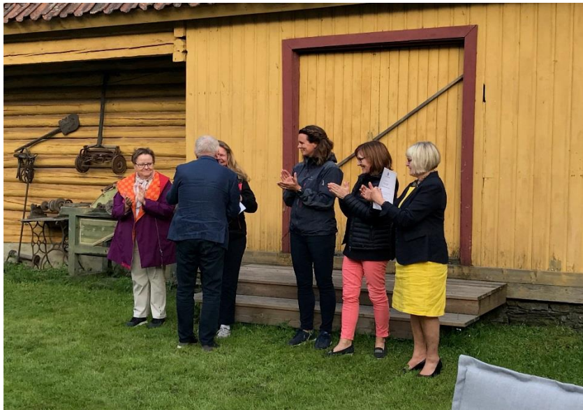
Medlemsopptak av 2 nye medlemmer i Porsgrunn Rotary, juni 2018