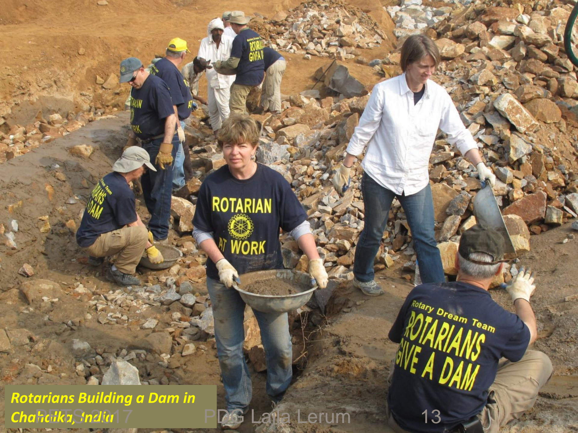
Rotarians Building a Dam in Chaika, India