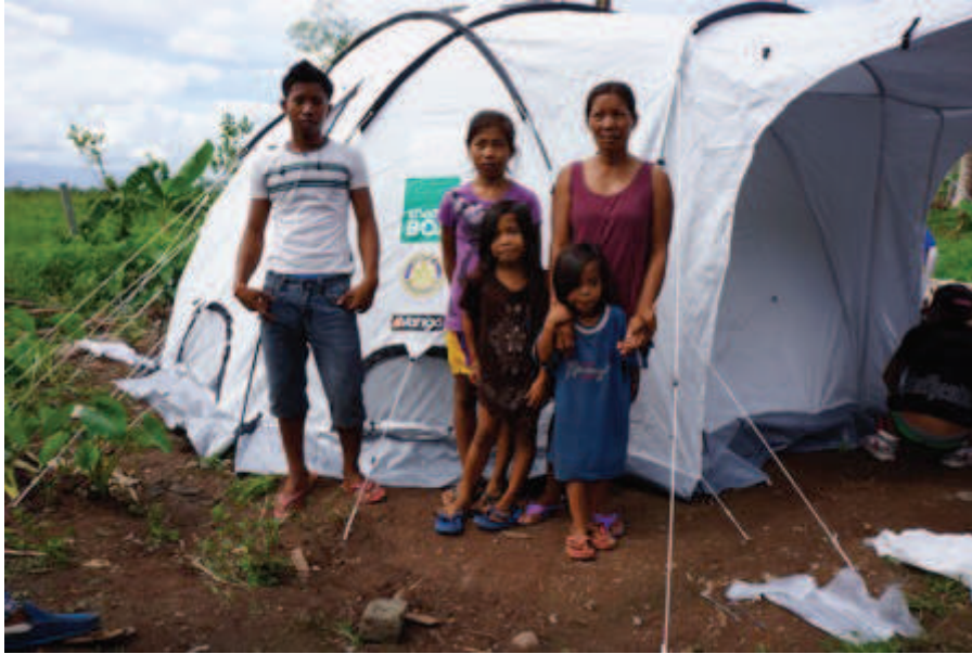
Enslig mor med 4 barn som nettopp har fått utlevert en ShelterBox, nord for Tacloban by.