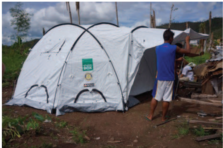
Bildet nedenfor er også fra samme området.