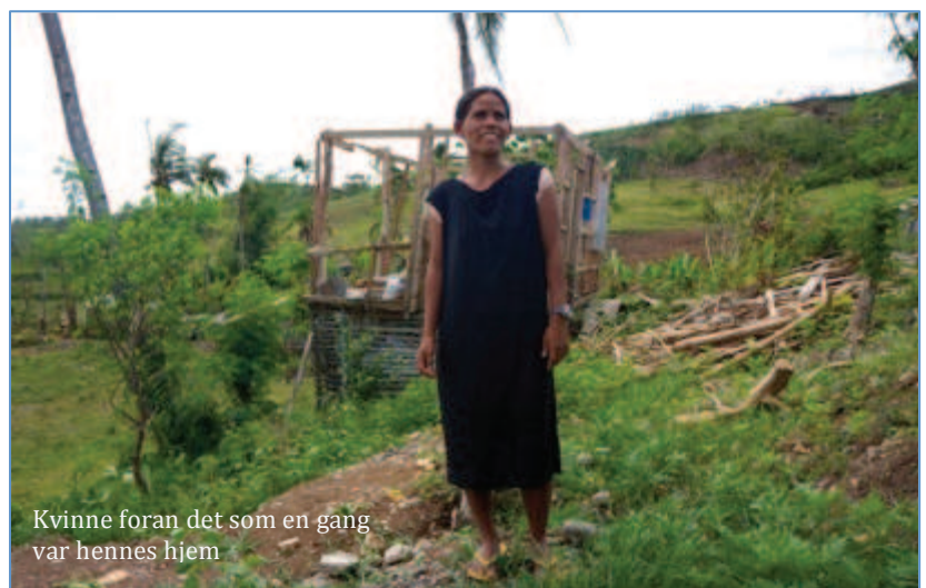
Kvinne foran det som en gang var hennes hjem

I Tabango besøker vi flere Barangays, noen av dem ligger uveisomt til og det er kun på mopeder vi kommer oss frem – 3 mann på hver.