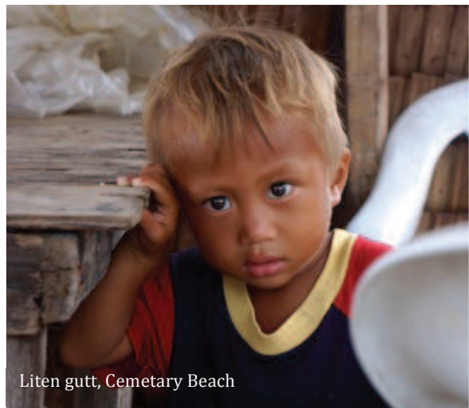
Liten gutt, Cemetary Beach

Mange filippinere snakker rimelig bra engelsk, men min erfaringer at jo lengre avsidesliggende folk bor dess verre er det med engelsken. Derfor hadde vi med oss en ungdom som var mannskap om bord på båten vi hadde. Dette var til god hjelp. Hvor enn vi kom, tok folk alltid god imot oss, smilende og vennlige.