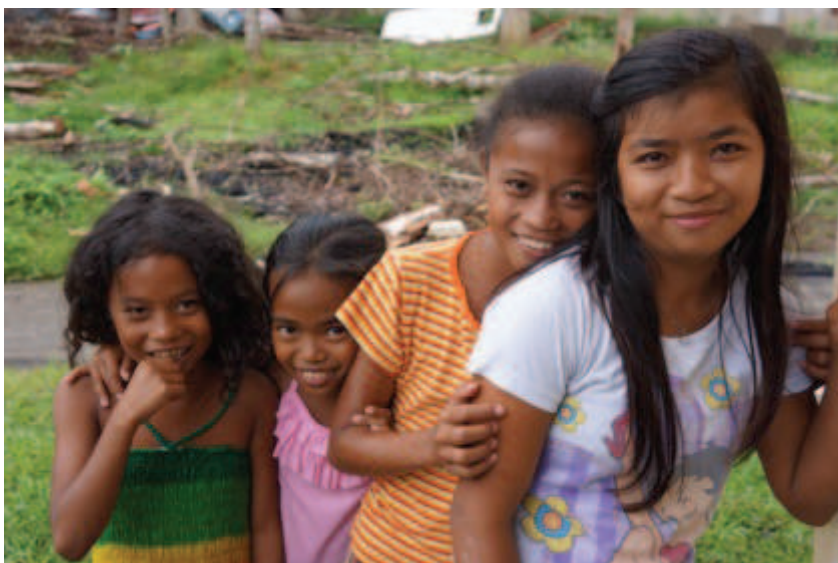
Glade jenter, Tacloban