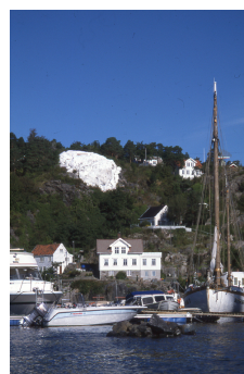
Bilde av Risørflekken

Den koster kroner 100 og blir din julegave til polioforebyggelse i verden. På Presidentsamlingen i januar 2014 tar jeg dette med meg, så dere kan bestille en hver.