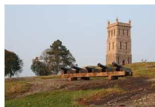
Bilde av slottsfjellet