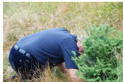
Guvernøren setter spor i Mandal

Guvernørens besøk til hver enkelt klubb er det viktigste virkemiddelet i kommunikasjonen mellom distrikt og klubb. Målet er å sikre en toveis kommunikasjon med vektlegging av klubbens behov for utvikling og Rotarys mål for inneværende år. Guvernøren besøkte i løpet av høsten og tidlig januar alle de 45 klubbene i distriktet. Klubbbesøkene ble gjennomført som to timers møte med styre og øvrig klubbledelse etterfulgt av møte med klubbens medlemmer. Besøkene var den mest arbeidskrevende del av guvernør oppgaven, men var samtidig den mest givende aktiviteten i løpet av året. Det var en glede å konstatere at de fleste av våre klubber fungerer godt med høy aktivitet og har et positivt miljø hvor medlemmene trives. Dette gjenspeiles i en lav turnover, 6 % i gjennomsnitt for distriktet, betydelig lavere enn RIs mål på maks 20%. 5 klubber hadde ingen avgang i løpet av året.