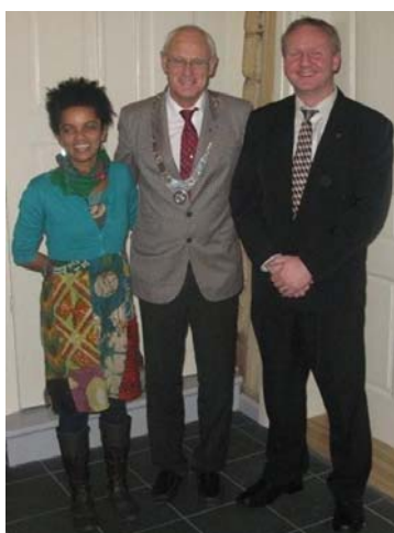
Sande RK viser veien med fremtidsrettet rekruttering

Arbeidet i distriktet med å rekruttere og med å beholde medlemmer har i likhet med de to foregående år hatt første prioritet i dette rotaryåret. Mange klubber har nedlagt stort engasjement og mye arbeid i organiseringen. Som nevnt tidligere er klubbenes arbeid med å beholde medlemmer meget tilfredsstillende og vi har en av de laveste "avgangsrater" i sonen. Behovet for rekruttering har vært understreket i alle sammenhenger, både ved klubb-besøk, ukebrev, ved PETS og presidenttreff og ved to medlemsseminarer som ble gjennomført i vinter.